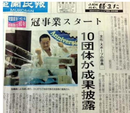
翌日、極真会館の演武を全面に掲載して頂いた室蘭民報の朝刊